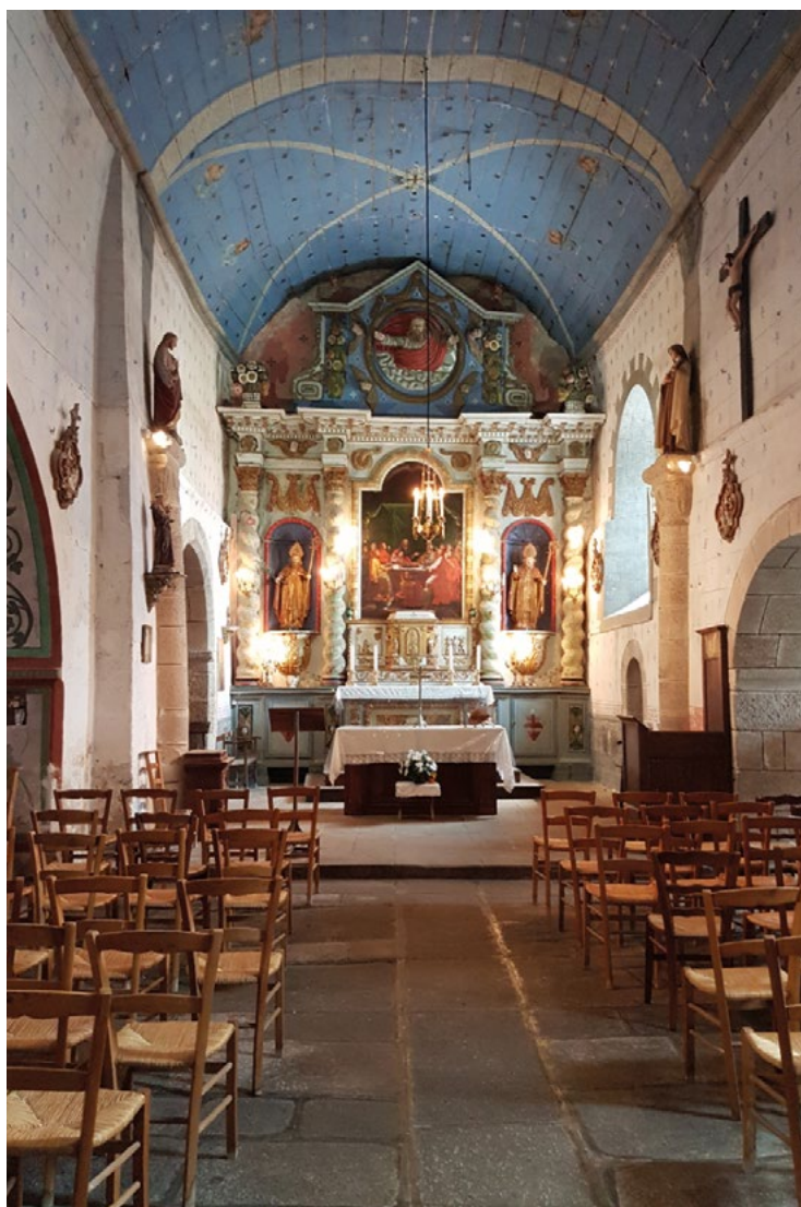
Eglise de Domeyrot