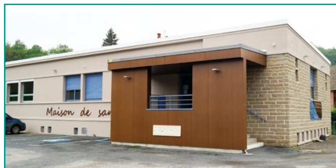
Maison de santé - Pôle de Chambon sur Voueize

Le pôle d'Evaux ouvrira dans un environnement agréable, avec une façade donnant sur la nature environnante et le château de Budelle et l'autre sur le parking aménagé dans le parc, à proximité des services santé que sont l'EHPAD et l'hôpital des Genêts d'or. Ces nouvelles structures complètent le maillage du territoire et facilitent un travail de concertation entre les professionnels de santé.