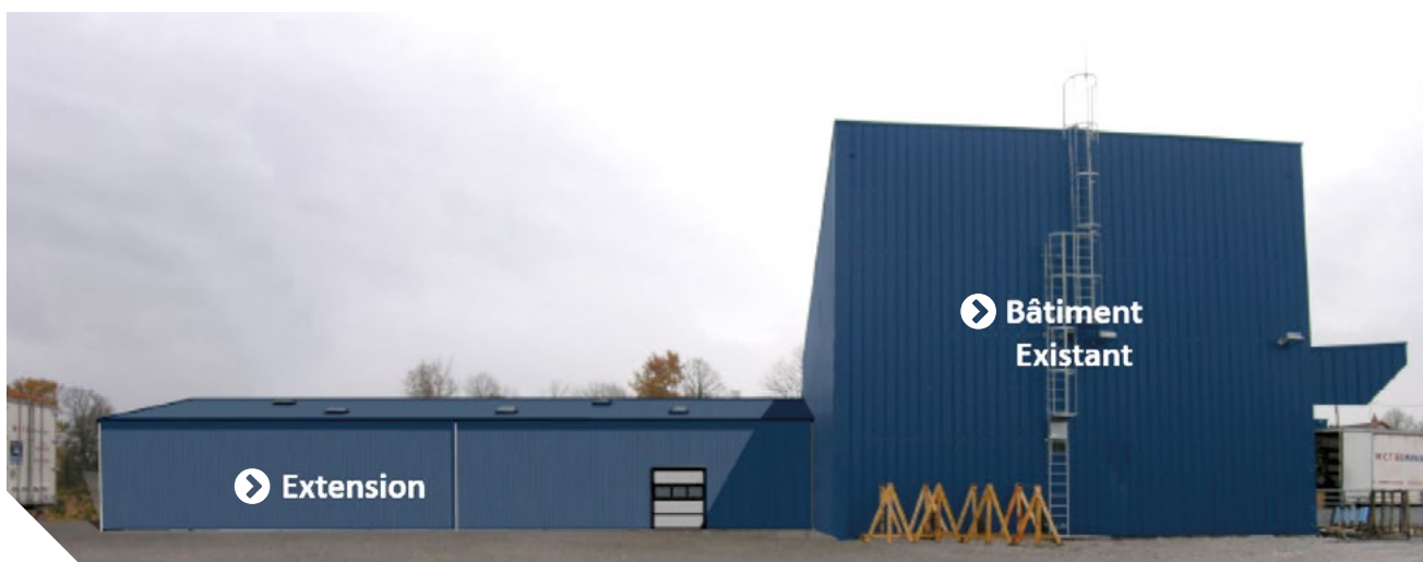
Projet d'extension MCT Déménagement

Désireuse de contribuer à la croissance économique du territoire, Creuse Confluence travaille également à l'élaboration d'un régime d'aides aux