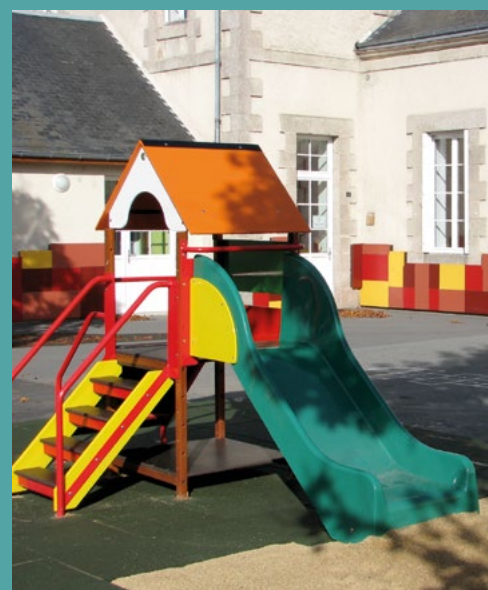
L'école de Gouzon

C'est le nombre d'enfants qui fréquentent les écoles de notre territoire, réparties sur 24 sites différents, parfois en RPI (regroupement pédagogique intercommunal). Creuse Confluence étudie actuellement la possibilité d'élargir la compétence école, déjà exercée sur l'ancien secteur du Carrefour des Quatre Provinces, à l'ensemble du territoire à compter de septembre 2019, dans une démarche de concertation avec les communes. Ses objectifs ? Offrir une égalité de service sur l'ensemble du territoire, au profit du bien-être des élèves et des conditions de travail des enseignants.