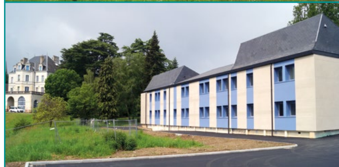
Maison de santé - Pôle d'Evaux les Bains Avant et après travaux